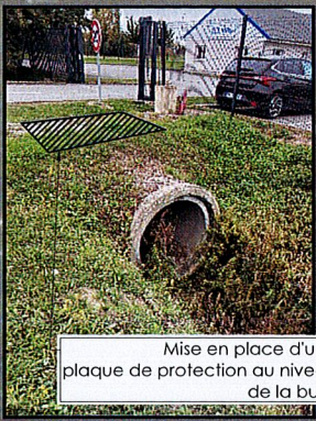
Mise en place d'une plaque de protection au niveau de la buse